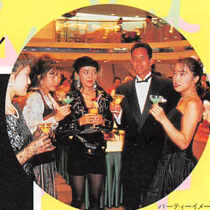
パーティーイメージ