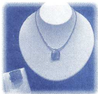
エメラルドとダイヤモンドのチェーン