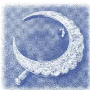
ダイヤモンドのブローチ