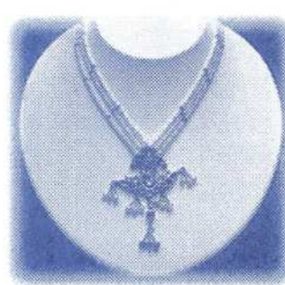
パールとルビーのネックレス